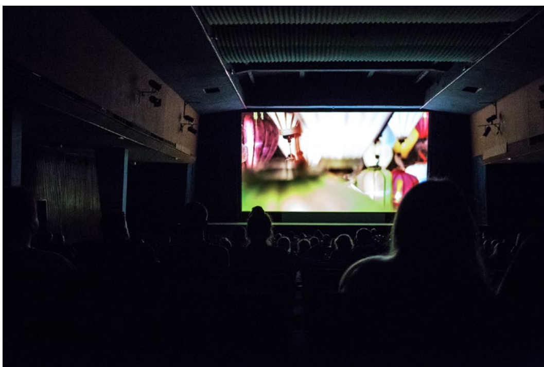
Festival 25 FPS